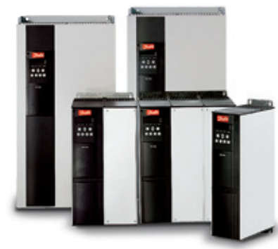
VLT® Soft Starter MCD 3000