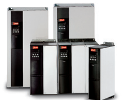
VLT® Soft Starter MCD 3000