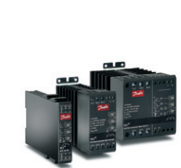
VLT® Compact Starter MCD 100