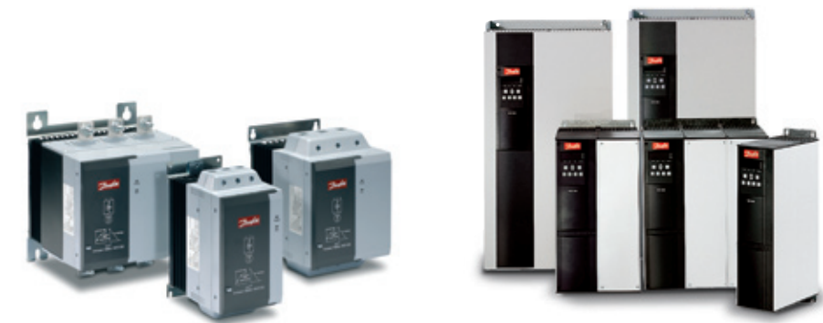
VLT® Compact Starter MCD 100