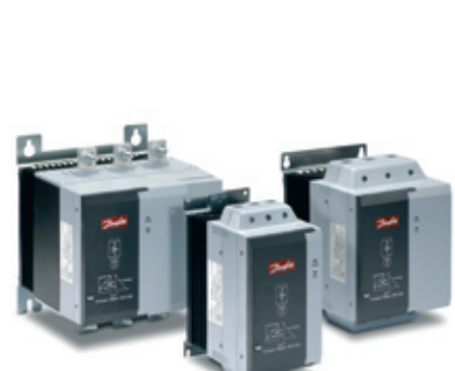
VLT® Compact Starter MCD 200